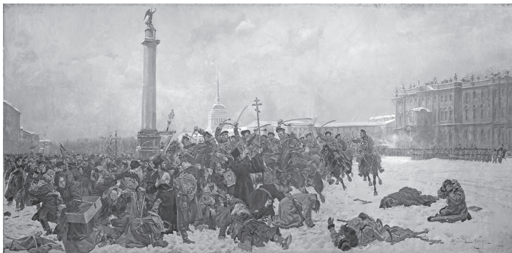
Рис. 5. Войцех Коссак. Кровавое воскресенье в Петербурге.

Второй священник рядом с Гапоном у Александрийского столпа на Дворцовой площади изображен на картине польского художника Коссака, выставившейся в Лондоне в ноябре 1905 г. 33 (см. рис. 5). Отголосок версии о том, что рядом с Гапоном были другие священники, имеется в воспоминаниях революционера Фельдмана о мятеже на броненосце «Потемкин» 34 . Упоминание о шедших рядом с Гапоном двух «попах-демократах» попало в книгу французских социалистов Лонге и Зильбера 35 .