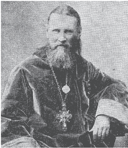
Рис. 1. Отец Сергей в версии английских и французских газет (The Daily Mirror. 1905. January 24. P. 1; Le Matin. 1905. 26 Janvier. P. 1; New York American. 1905. February 2. P. 1; La Vie Illustrée. 1905. № 329. 3 Février. P. 291)