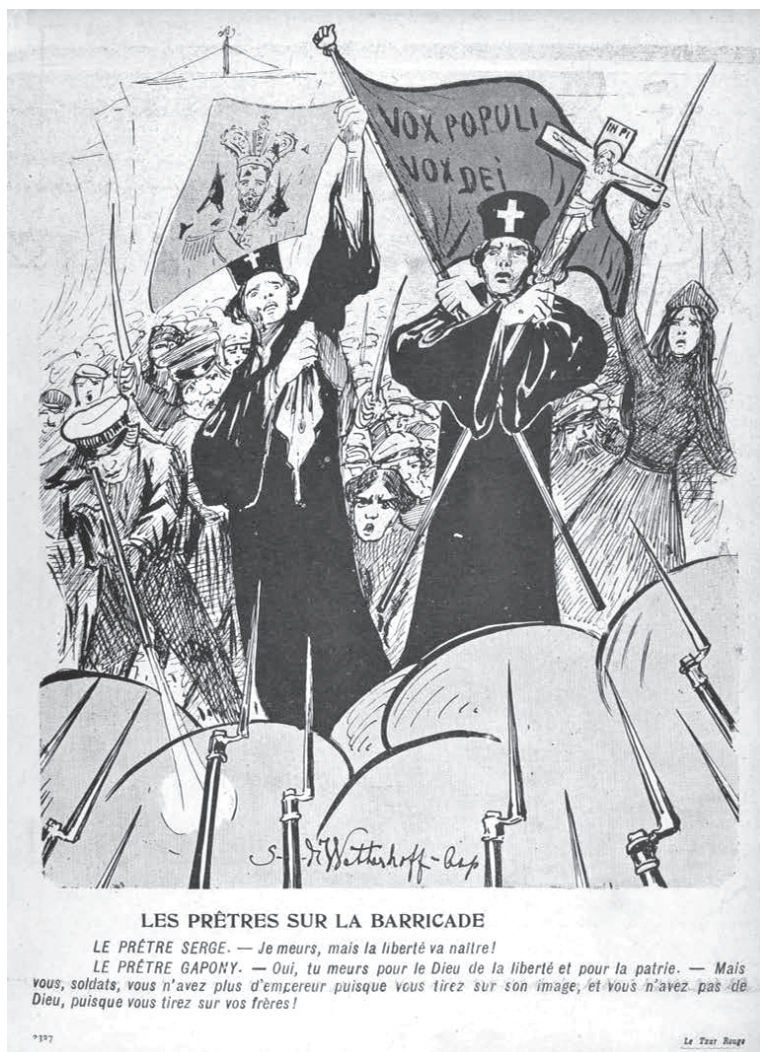
Рис. 4. Гапон и «отец Серж» на баррикадах ( L'Assiette au Beurre . 1905. № 201. 4 Février. P. 3327)

В парижском еженедельнике Assiette au Beurre финляндский художник Веттерхофф-Асп поместил рисунок, изображающий «священников на баррикадах» — «Сержа» и «Гапони». «Поп Серж» погиб на баррикадах за свободу (рис. 4).