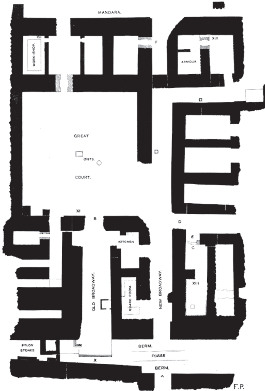
Рис. 3. Общий план дворцового комплекса Априя, по Ф. Питри [15: рл. 1]

была в верхней части около 10 м, в нижней — 2,7 м. Через ров был, вероятнее всего, переброшен мост. Широкий проход вел от ворот в большой зал — центральную часть дворца. Ее окружали арсенал, кухни, мастерские, приемные покои [15: р. 1–3]. При расчистке рва Питри в числе прочих находок были обнаружены отпечатки печатей с клинописными надписями и деревянные ярлыки с надписями