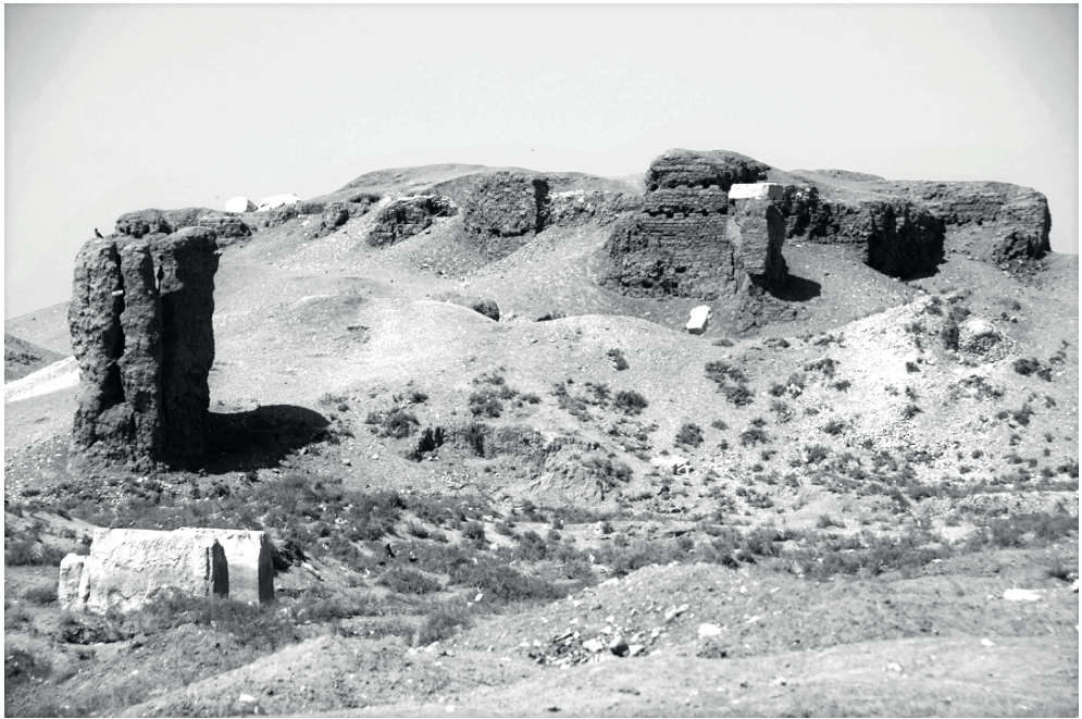
Рис. 2. Руины дворца Априя

должны были служить опорой власти в конфликте между правителем, происходившим из Дельты, и жителями Мемфиса [17: р. 83–84].