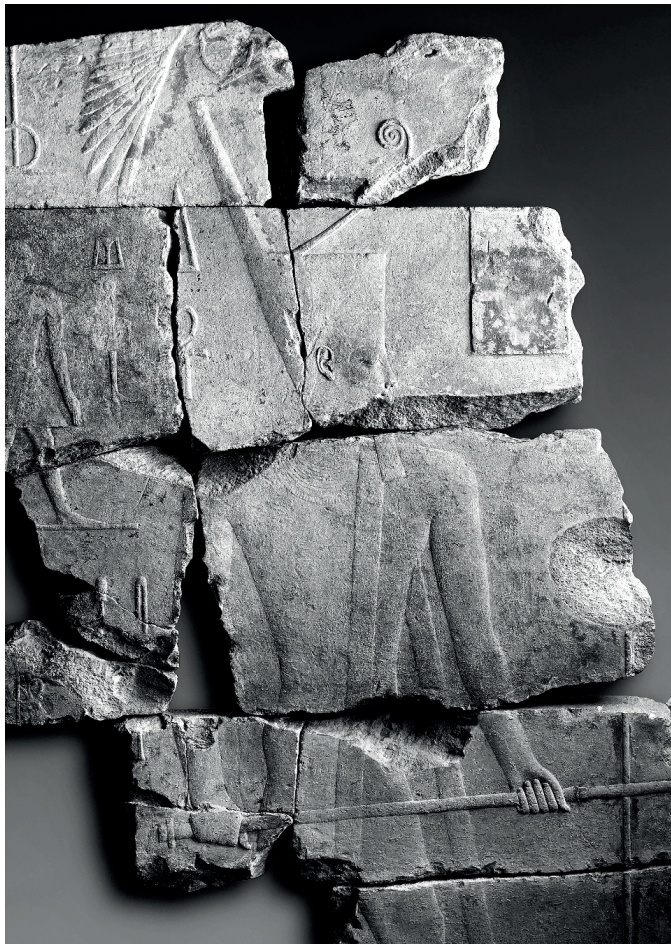
Рис. 4. Рельеф, изображающий Априя в ходе празднования хеб-седа (Метрополитен-музей, Нью-Йорк, цифровой идентификатор 547705 4 )

Если же обратиться к более ранней истории Мемфиса и попытаться выяснить, где находился центр города в раннем Древнем царстве, то, основываясь на вышеизложенной схеме, предложенной Гидди, можно предположить, что центр Мемфиса мог находиться и на территории Ком-Тумана. Памятник располагается напротив заупокойного комплекса Джосера и на той же широте, что и Ком-Раба, куда впоследствии при VI династии переместился центр города. Как полагает историк древнеегипетской архитектуры А. Бадави, дворец Априя мог быть построен внутри внешней стены, которая окружала мемфисский дворец Джосера [2: р. 29]. Свое предположение он аргументировал сходством размеров заупокойного комплекса Джосера и внешней стены, окружающей дворец Априя.